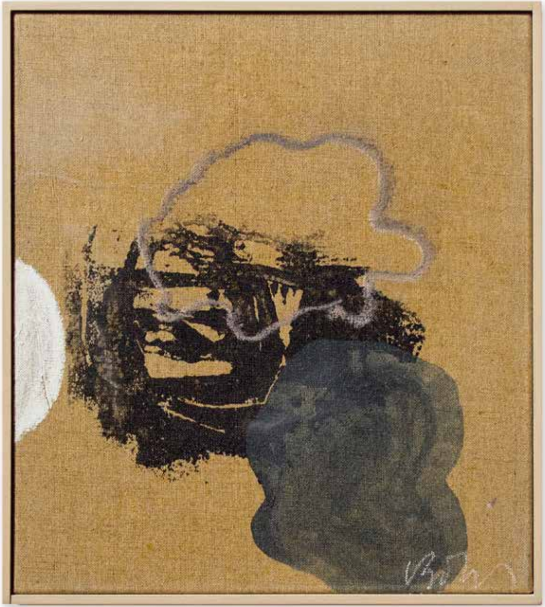
Ohne Titel, Acryl auf Leinwand, 30 x 32,5 cm, 2003