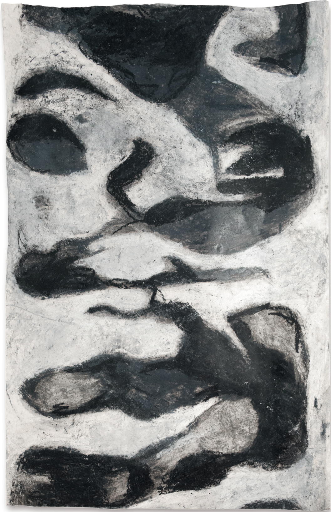
Wasserfall, techniques mixtes auf Papier, 61 x 89,5 cm, 2019